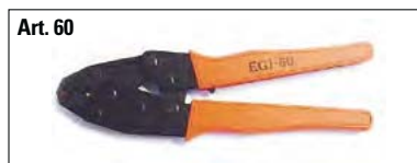
Art. 60 Cricchetto per preisolati 0,25 a 6 mm 2 . Doppia aggraffatura (+ punzonatura controllo qualità).

PINZE CONSIGLIATE PER LA CRIMPATURA DEI TERMINALI PREISOLATI PER SEZIONI DA 0,25 A 6 mm 2 TOOLS SUGGESTED FOR CRIMPING PRE INSULATED TERMINALS WIRE RANGE FROM 0,25 TO 6 mm 2