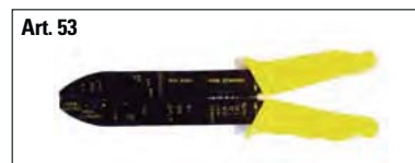
Art. 53 Nudi e preisolati da 0,25 a 6 mm 2 .