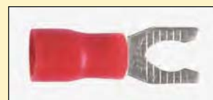
Forcella con blocco tipo "S" - A 135S/P Locking fork terminals "S" type - A 135S/P