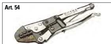
Art. 54 Preisolati doppia aggraffatura 0,25 a 6 mm 2 . Taglia e spela fili manualmente