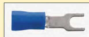
Forcella colletto lungo - B 135L/P Fork terminal with long neck - B 135L/P