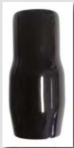
CAPIUCCI ISOLANTI PER CAPICORDA DA TUBO. COLORE NERO TIPO P

SOFT SLEEVES FOR TUBE TERMINALS COLOUR BLACK - TYPE P